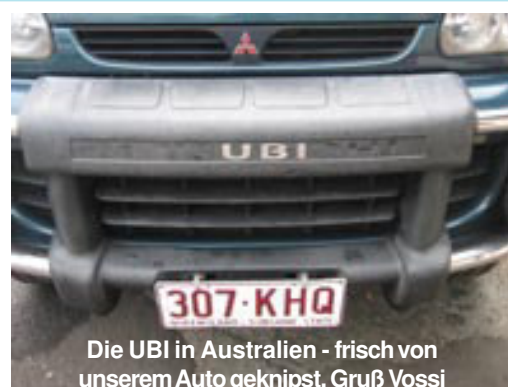
Die UBI in Australien - frisch von unserem Auto geknipst. Gruß Vossi