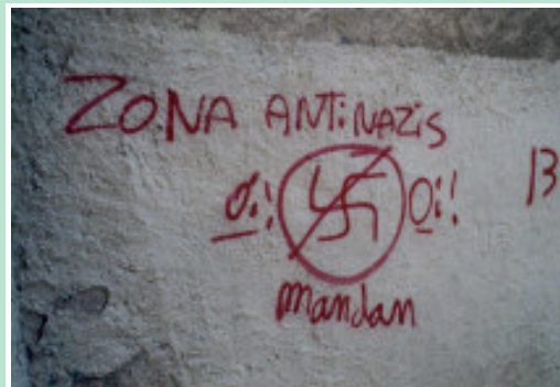
Ein Schnappschuß aus Spanien von Sabine S.

Der ganze Artikel wie angegeben über die TAZ oder in unserer Onlineausgabe: www.ubi-mieterladen.de/be2.html